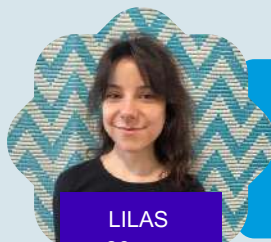
LILAS 26 ans