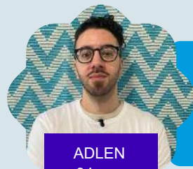
ADLEN 34 ans

« J'ai fait un échange de jeunes à Mayotte qui me permet depuis 2023 d'être EuroPeers. J'ai pu faire des rencontres incroyables et découvrir une nouvelle culture. Être EuroPeers est une chance énorme pour pouvoir représenter ma région et mon île à l'international. »