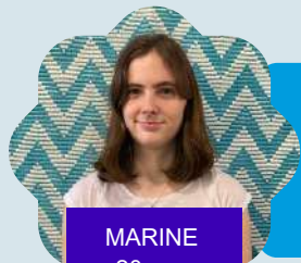
MARINE 20 ans