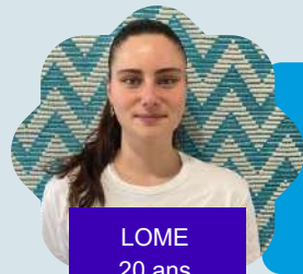
LOME 20 ans