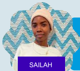
SAILAH 21 ans